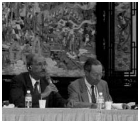
Bill Sinkford, az UUA elnöke (USA) előadást tart a Világkongresszus plenáris ülésén

Az elmúlt több mint száz évben folyamatosan bővült a tagsága, mára 25 országban több mint 90 tagszervezete van a világ minden tájáról. Az erdélyi unitáriusok a szervezet megalakulása óta részt vettek az IARF munkálataiban. Jelenleg az IARF tagságának többségét elsősorban a távol-keleti vallások képviselői jelentik. Ilyenként jelen vannak a buddhista, sin-