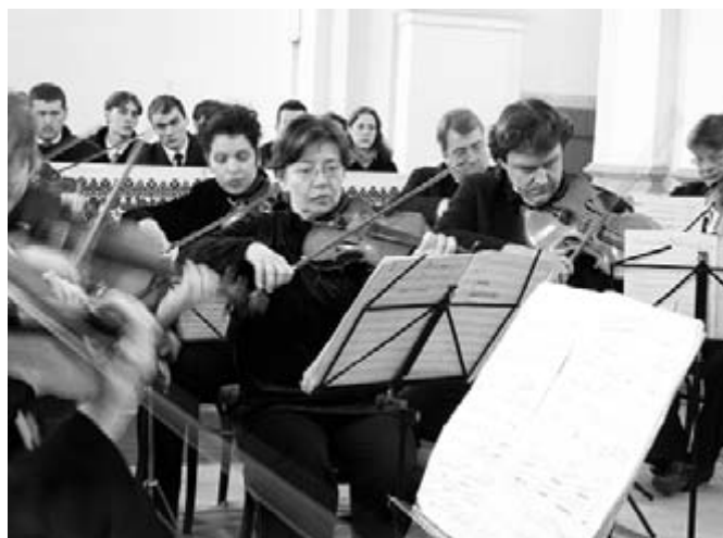
Bartók Divertimentóját a Transilvania Filharmónia kamarazenekara adta elő

verzális zenei „ötvöseként”, illetve a zene-világirodalom kozmopolita nagyságaként szoktak megemlékezni. Angi István ezúttal – különleges csemege gyanánt – néhány olyan hangillusztrációt hozott magával, amelyeken maga Bartók játssza zongoraműveit. Az illusztratív anyag egyúttal arra is szolgált, hogy a március 26-i programból teljesen hiányzó bartóki zongorairodalmat képviselje – mégpedig dokumentáris értékkel.