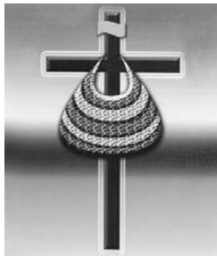
A nők idei világimanapjának emblémája

külföldre vándorolnak. A közlekedési infrastruktúra hiányos, sok az elszigetelt helység. Itt a lakosság önellátó, maguk oldják meg minden problémájukat. A bennszülöttek ősi hitvilága, gyógy módjai mellett a nyugati misszionáriusok behozták a keresztény eszméket, a nyugati gondolkodásmódot, szociális projekteket, a nők emancipációját. Mégis Pápua Új-Guineában a legtöbb nő helyzete hátrányos. A törvény ugyan tiltja a nők diszkriminációját,